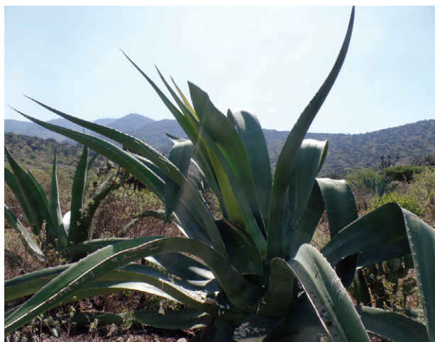
Figura 5. Variedad de Magüey chalqueño ( Agave salmiana var. 'Salmiana')

El Magüey chalqueño se encontró presente en las localidades de El Mendoza y La Cruz del municipio de Francisco I. Madero (Figura 5). Según la guía de descripción varietal, el Magüey chalqueño es una planta de hábito de crecimiento acaulescente con tallo arrosado no visible presentando alturas promedio de 2.57 m diámetros de roseta de 2.52 m y al momento de estudio 68 hojas. La relación longitud-ancho de hoja fue de 9, encontrando longitudes de 207 cm y anchos de 23 cm.