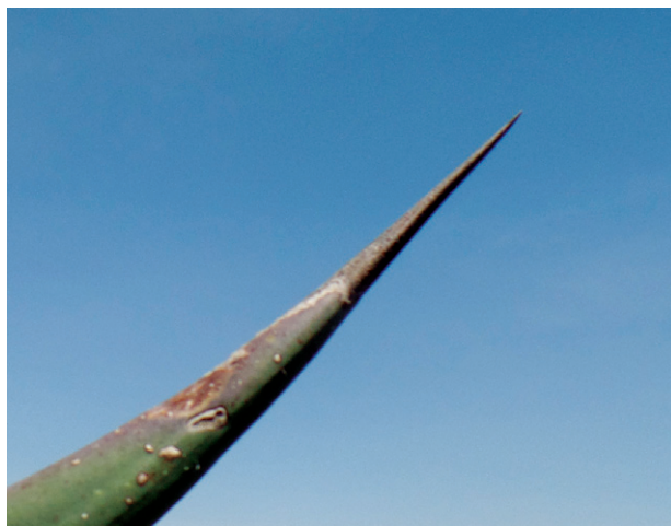
Figura 4d. Forma de espigas laterales

Según los productores, la planta alcanza su edad adulta aproximadamente a los 12 años y es de prolificidad baja en la producción de hijuelos.