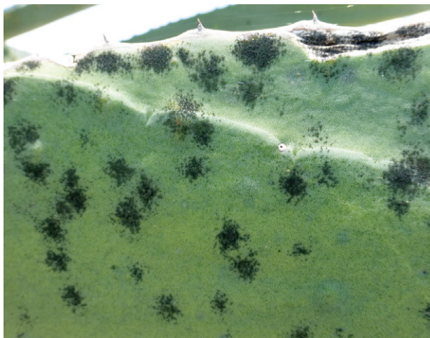
Figura 10. Viruela de la penca de maguey.

El daño es causado por un hongo. Al inicio se pueden ver pequeñas áreas oscuras parecidas a manchas de un marcador (Figura 10). Generalmente afecta las pencas bajas; cuando el daño es severo llega a necrosar la penca. Cuando el hongo se presenta en un hijuelo recién plantado, el daño es severo (Cesaveg, 2008).