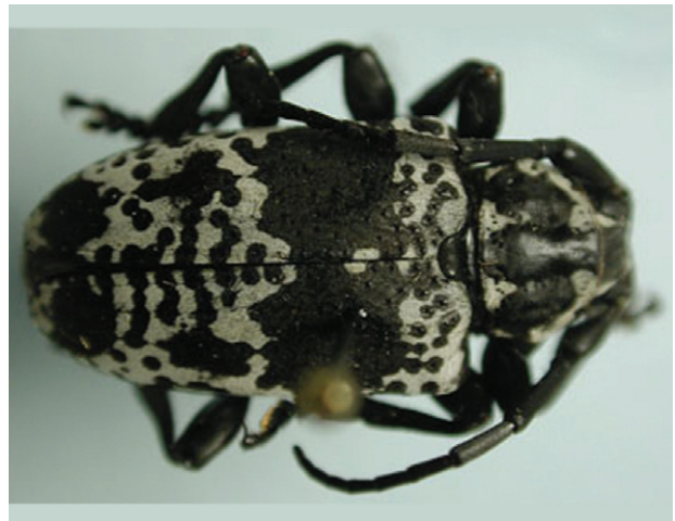
Figura 7. Escarabajo cerambícido adulto.

Esta plaga ha sido poco estudiada y sin embargo se han encontrado algunas parcelas y localidades donde los daños causados por este insecto afectan al cultivo. Una de las razones de su importancia es que al causar heridas en la planta, permite la entrada de fitopatógenos que ocasionan enfermedades y debilitan a las plantas. Tienen el cuerpo alargado y cilíndrico con antenas de longitud mayor a la mitad de su cuerpo. Los ojos generalmente tienen forma arriñonada, parcial o totalmente divididos, estos escarabajos tienen color negro brillante con manchas blancas en la parte anterior y en el tercio posterior de los élitros (Figura 7). El insecto mide cerca de 2 cm de longitud y sus antenas miden alrededor de 1.5 cm (Pérez et al. , 2007).