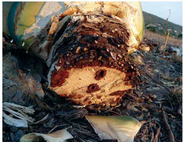
Figura 6. Daños en maguey por chinicuil.