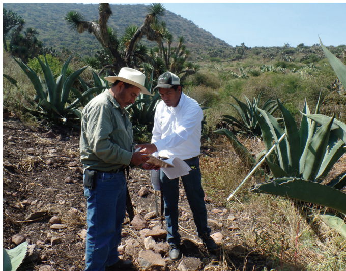
Figura 2. Caracterización morfológica de agaves

La caracterización morfológica de los magueyes se realizó a través de guía técnica para la descripción varietal de Agave spp. (SAGARPA, 2014), esta guía se apega a lo dispuesto en la NOM-001-SAG/FITO-2013.