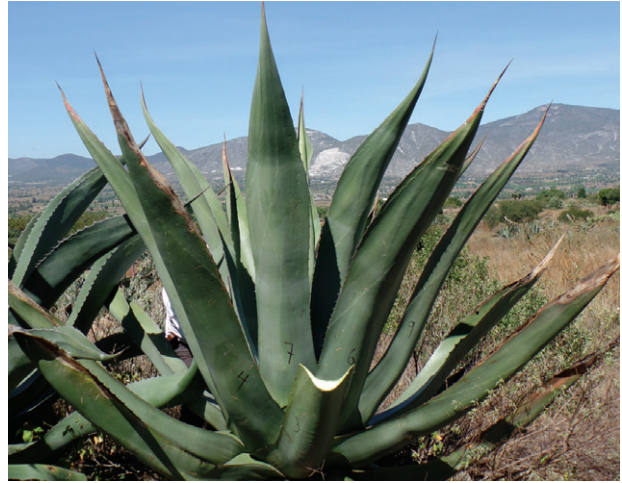
Figura 3. Variedad de Magüey manso ( Agave salmiana var. 'Salmiana')

El magüey manso se encontró presente en las localidades de El Mendoza y La Cruz del municipio de Francisco I. Madero (Figura 3). La descripción del magüey manso según la guía de descripción varietal indica que es una planta de hábito de crecimiento acaulescente con tallo arrosetado no visible, presentando alturas promedio de 2.36 m diámetros de roseta de 2.38 m y, al momento de estudio, 42 hojas. La relación longitud: el ancho de hoja fue de 5 encontrando longitudes de 177 cm y anchos de 33 cm.