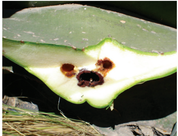
Figura 8b. Daños en penca por gusano blanco.