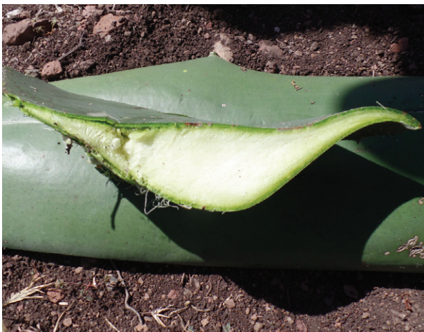
Figura 8. Morfología de corte transversal

En las hojas hay curvatura y su morfología de corte transversal es en forma de quilla (Figura 8). El maguey tiene mediano número de pequeñas espinas laterales monofurcadas curvas de color negro homogéneas, separadas entre sí por 4 cm (Figura 9). Las espinas terminales son rectas de 5 cm de longitud.