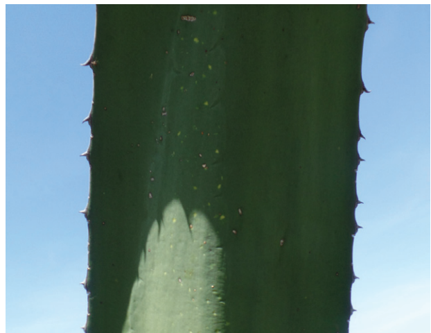
Figura 9. Número de espinas laterales