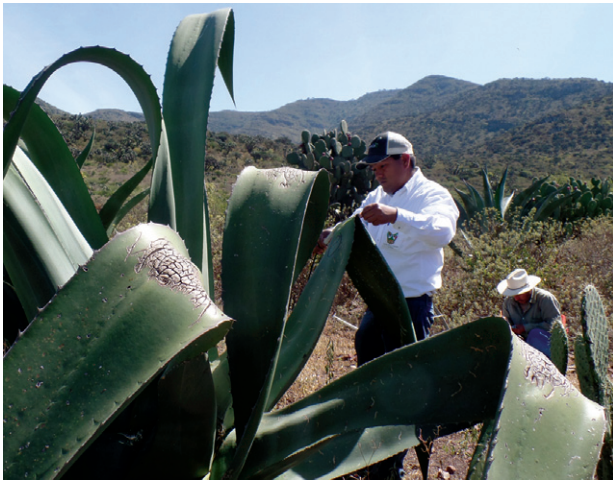
Figura 6. Color y morfología de hoja

Esta variedad de maguey presenta hojas de color verde de forma lanceolada con textura lisa, sin glaucencia y con línea de color morado en el margen del borde dentado (Figura 6 y 7).