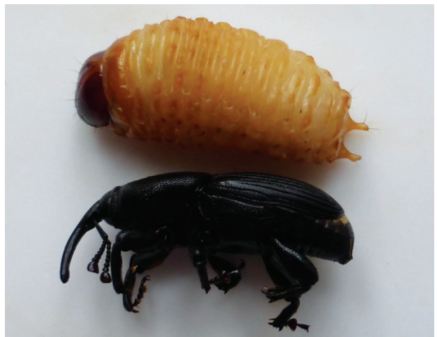
Figura 4. Larva y adulto del picudo.