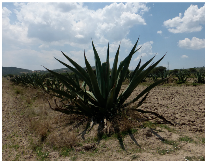
Figura 1. Planta adulta de Maguey manso o Maguey pulquero.

El maguey lo podemos describir como una planta de tamaño mediano a grande, con el tallo grueso y corto, que se presenta en forma de roseta de 1.5 a 2.0 m de altura con el doble de amplitud. Presenta hojas de 100 a 200 cm de largo y de 20 a 35 cm de ancho, de forma lineal y lanceolada, acuminadas, carnosas de color verde grisáceo, cóncava hacia arriba, ápice curvado y con espinas de 5 a 10 mm de largo y de 3 a 5 cm de distancia entre ellas. Cuando se presenta el escapo floral es de 7 a 8 m de alto con ovarios cilíndricos de 50 a 60 mm de largo. La planta tiene múltiples usos como forraje, combustible, comestible, productora de aguamiel, pulque y mezcal (Figura 1) (SEDARH, 2008).