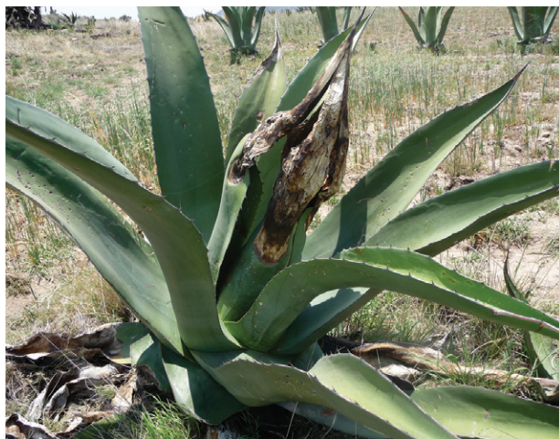
Figura 9. Daño ocasionado por bacterias en plantas de maguey.

Los síntomas de estas bacterias inician en la espina apical o en espinas laterales, éstos avanzan hacia el centro de la penca causando una pudrición negra descendente hasta la piña con la pérdida del cogollo, contaminando y retrasando el desarrollo de la planta, siendo favorecidas por la humedad de las hojas internas del cogollo y a la falta de oxigenación (Figura 9). Puede ser transmitida por insectos que causan heridas (p. ej. picudo). En la marchitez bacteriana, la pudrición afecta las pencas (Cesaveg, 2008).