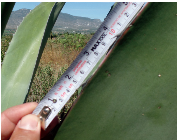
Figura 4a. Distancia entre espinas

Esta variedad de magüey presenta hojas de color verde amarillo de forma lanceolada con textura lisa, sin glaucencia y con línea de color morado en el margen del borde dentado. En las hojas no hay curvatura y su morfología a corte transversal es en forma de U. El Magüey manso tiene un poco número de pequeñas espinas laterales monofurcadas curvas de color negro homogéneas, separadas entre sí por 6 cm (Figura 4a, 4b y 4c). Las espinas terminales son rectas largas de 8 cm de longitud (Figura 4d).