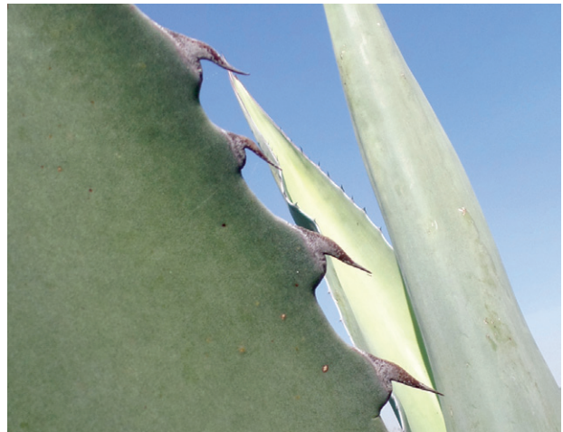
Figura 4b. Forma de espinas laterales