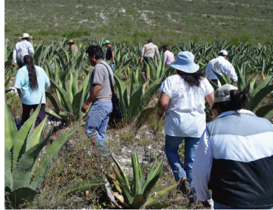
Figura 10. Cultivo de Magüey xamini

En los predios de los productores de magüey del municipio de Francisco I. Madero predomina el magüey pulquero de variedad Xamini (Figura 10). Según los productores, es un tipo de magüey que puede ser aprovechado para la producción de aguamiel a partir de su séptimo año de vida, además de que es un magüey que produce mayor número de hijuelos.