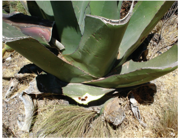
Figura 8a. Daños en penca por gusano blanco.

Junto con los escamoles, el gusano de maguey es el insecto mexicano que ha alcanzado mayor prestigio gastronómico mundial, siendo apreciado por todos los sectores de la sociedad mexicana (aunque, por su alto precio, su consumo ha quedado reservado a los sectores adinerados). Cocinado tiene tamaño y consistencia semejantes a los de una patata a la francesa, pero un sabor delicado y exquisito. (Enciclopedia de México, 2003).