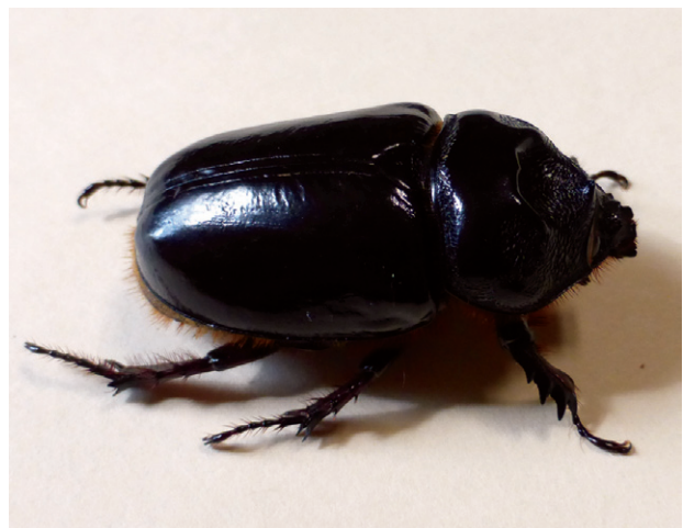
Figura 2b. Insecto adulto de gallina ciega.