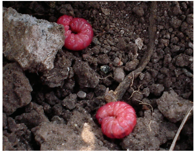
Figura 5. Larva de chinicuil.

El chinicuil como es conocido o gusano rojo de maguey de la familia Cossidae tiene una gran demanda temporal como alimento debido a su sabor y por ser rico en proteínas, aminoácidos y grasas no saturadas, además en la industria del mezcal es indispensable para el producto de exportación (Figura 5). Las larvas se alimentan de la base de las hojas pegadas al tronco (tallo) de magueyes de menos de un metro de altura y los tejidos subterráneos del maguey (Figura 6). Viven en grupos dentro del tejido vegetal y conforme van creciendo emigran hacia el centro del tallo formando galerías en las cuales se desarrollan durante medio año aproximadamente, estos daños repercuten en el crecimiento de los magueyes pero el mayor daño es el que causan las personas que se dedican a la recolecta clandestina de estas larvas para su venta al quebrar las plantas pequeñas (Nieto et al. , 2013).