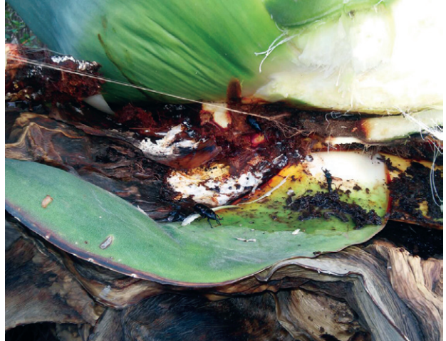
Figura 3. Maguey dañado por picudo.

Este insecto está distribuido en todas las áreas de agave y se encuentra activo durante todo el año, la hembra adulta oviposita cerca del ápice del cogollo, al emerger la larva hace una galería perforando las hojas que aún no han abierto. Es posible encontrar larvas o adultos en los cocones formados por fibra del agave en la parte atacada (Figura 3). La larva es de color blanquecino, dura en promedio 108 días, es robusta, ápoda, con la cabeza color café oscuro fuertemente esclerosada, en el último segmento abdominal presenta dos prolongaciones ligeramente esclerosadas con tres setas largas cada una; miden aproximadamente 15 mm en su última etapa de desarrollo. Los adultos son picudos de color negro, tienen una longitud aproximada de 17 mm (Figura 4). La hembra pone de 25 a 50 huevecillos. El ciclo de vida de huevo a adulto puede durar hasta 125 días dependiendo de las condiciones ambientales (Solís et al. , 2001).