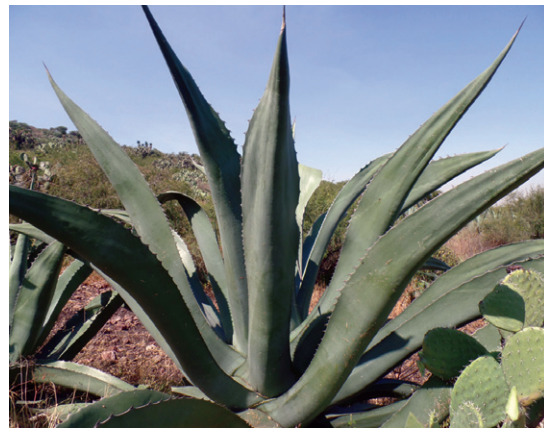
Figura 11. Variedad de Magüey xamini ( Agave salmiana var. 'Salmiana')

El Magüey de variedad xamini es una planta de hábito de crecimiento acaulescente con tallo arrosetado no visible, presentando alturas promedio de 2.74 m, diámetros de roseta de 2.68 m y al momento de estudio 49 hojas (Figura 11). La relación longitud-ancho de hoja fue de 5 encontrando longitudes de 198 cm y anchos de 38 cm.