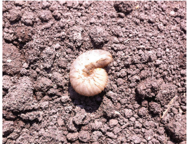
Figura 2a. Larva de gallina ciega.

Son larvas de insectos del suelo de diversas especies del orden Coleóptera (escarabajos) de los principales géneros son: Phyllophaga , Cyclocephala , Anomala y Macroductylus que causan serios daños a la raíz del agave. En plantaciones de magueyeras se han presentado pérdidas fuertes durante el primero y segundo año de la plantación, ocasionadas por el complejo de gallinas ciegas. La distribución de estos insectos plaga abarca prácticamente todas las zonas productoras de agave Jalisco, Michoacán, Hidalgo, Guanajuato y Tamaulipas. En muchas de estas entidades, la gallina ciega es una plaga de importancia económica (Figuras 2a y 2b). Algunas de las especies de gallina ciega que afectan al agave, atacan también al maíz, sorgo, caña de azúcar, papa, espárrago, tomate, pastos y otros cultivos hortícolas y ornamentales (Morón, M. A. 2001 y Pérez et al. , 2007).