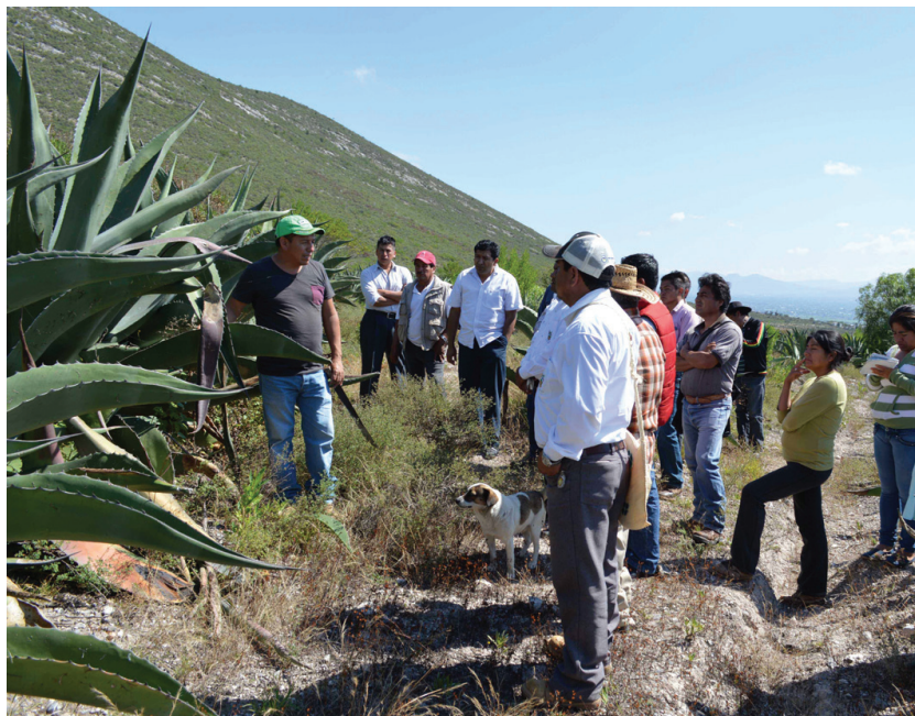
Figura 1. Recorrido de campo con productores

El trabajo se realizó con metodología participante, utilizando las técnicas de transecto en campo donde los productores identificaron los tipos de maguey pulquero presentes en sus áreas de cultivo (Figura 1).