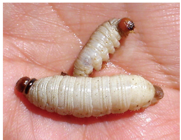
Figura 8c. Larva de gusano blanco.