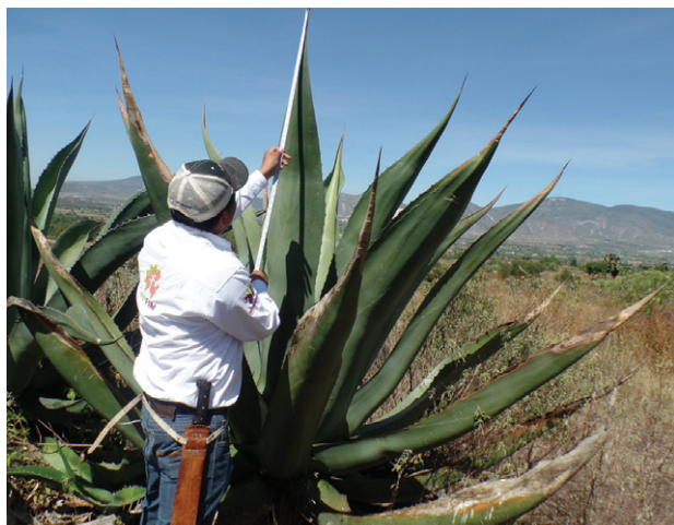
Figura 4c. Forma de espigas laterales